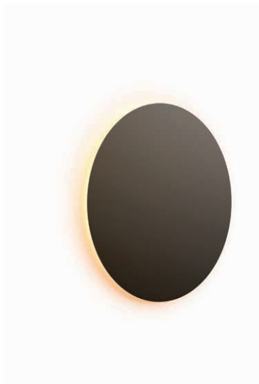
EC01-03 grande EC02-03 chica negro semimate