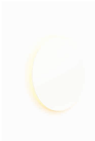
EC01-02 grande EC02-02 chica blanco semimate