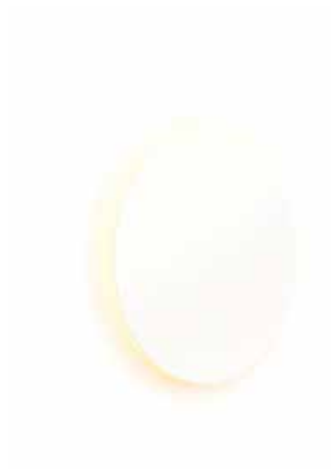
EC01-02 grande EC02-02 chica blanco semimate