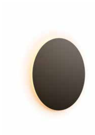
EC01-03 grande EC02-03 chica negro semimate