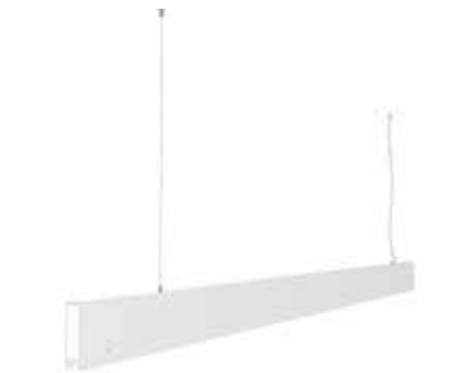
ML01-02 blanco semimate