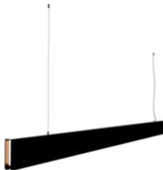
ML01-03 negro semimate