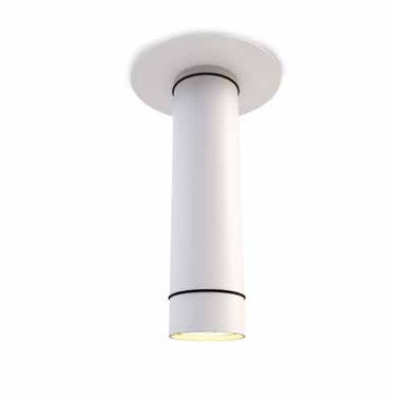
CV09-02 blanco semimate