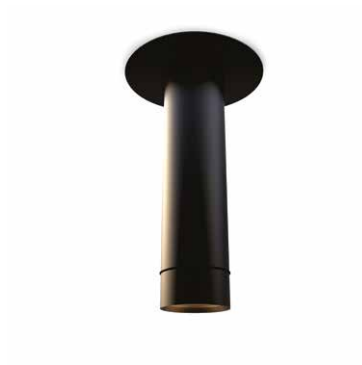
CV09-03 negro semimate