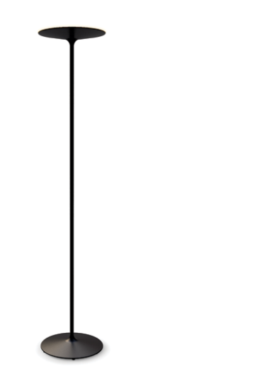
HH22-03 negro microtexturado semimate