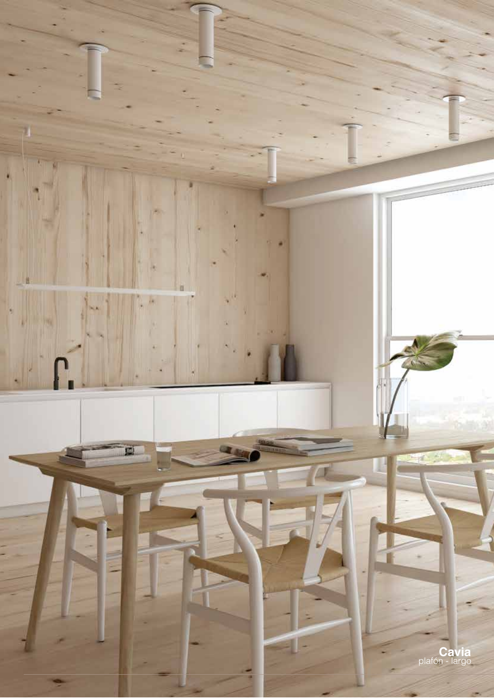
Cavia plafón - largo