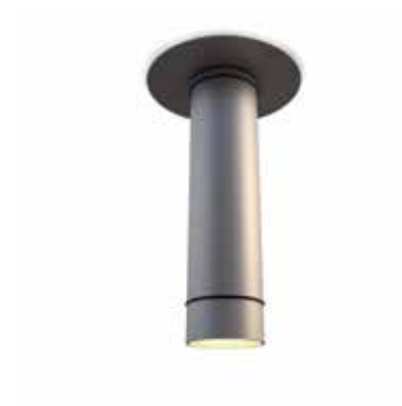
CV09-04 gris anodizado natural