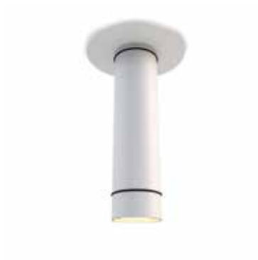
CV09-02 blanco semimate