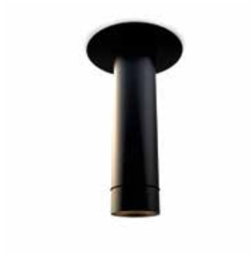
CV09-03 negro semimate