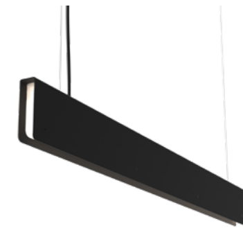
ML02-03 - corto negro semimate