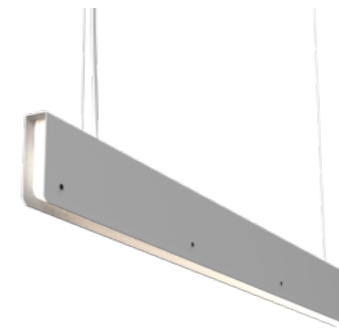
ML02-02 - corto blanco semimate