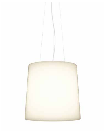
HH19-02 PE blanco opalino