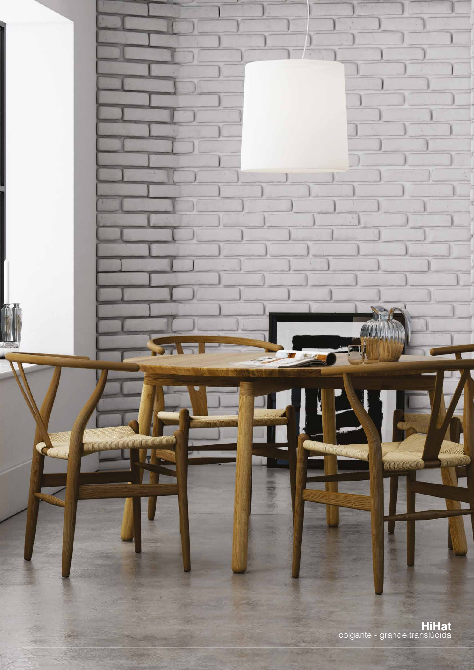
HiHat colgante - grande translúcida