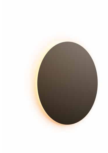
EC01-03 / aluminio 60 EC02-03 / aluminio 45 negro semimate