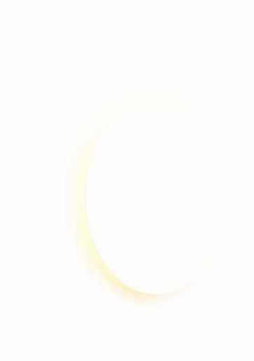
EC01-02 / aluminio 60 EC02-02 / aluminio 45 blanco semimate